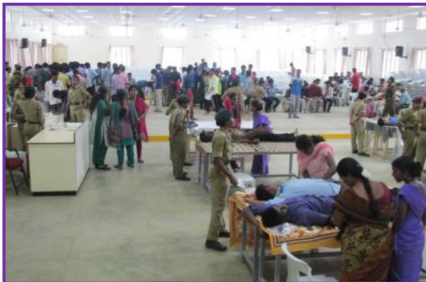
Our 104 cadets were happily participated in the Blood Donation Camp